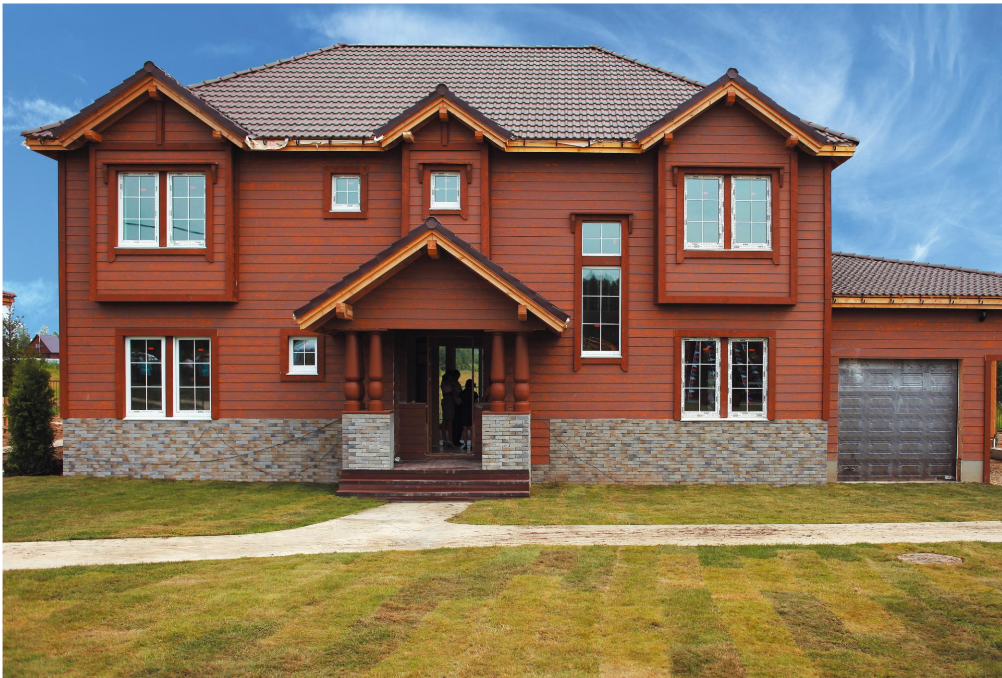
КОТТЕДЖНЫЙ ПОСЕЛОК «АМЕРИКАН ДРИМ». МОСКОВСКАЯ ОБЛАСТЬ