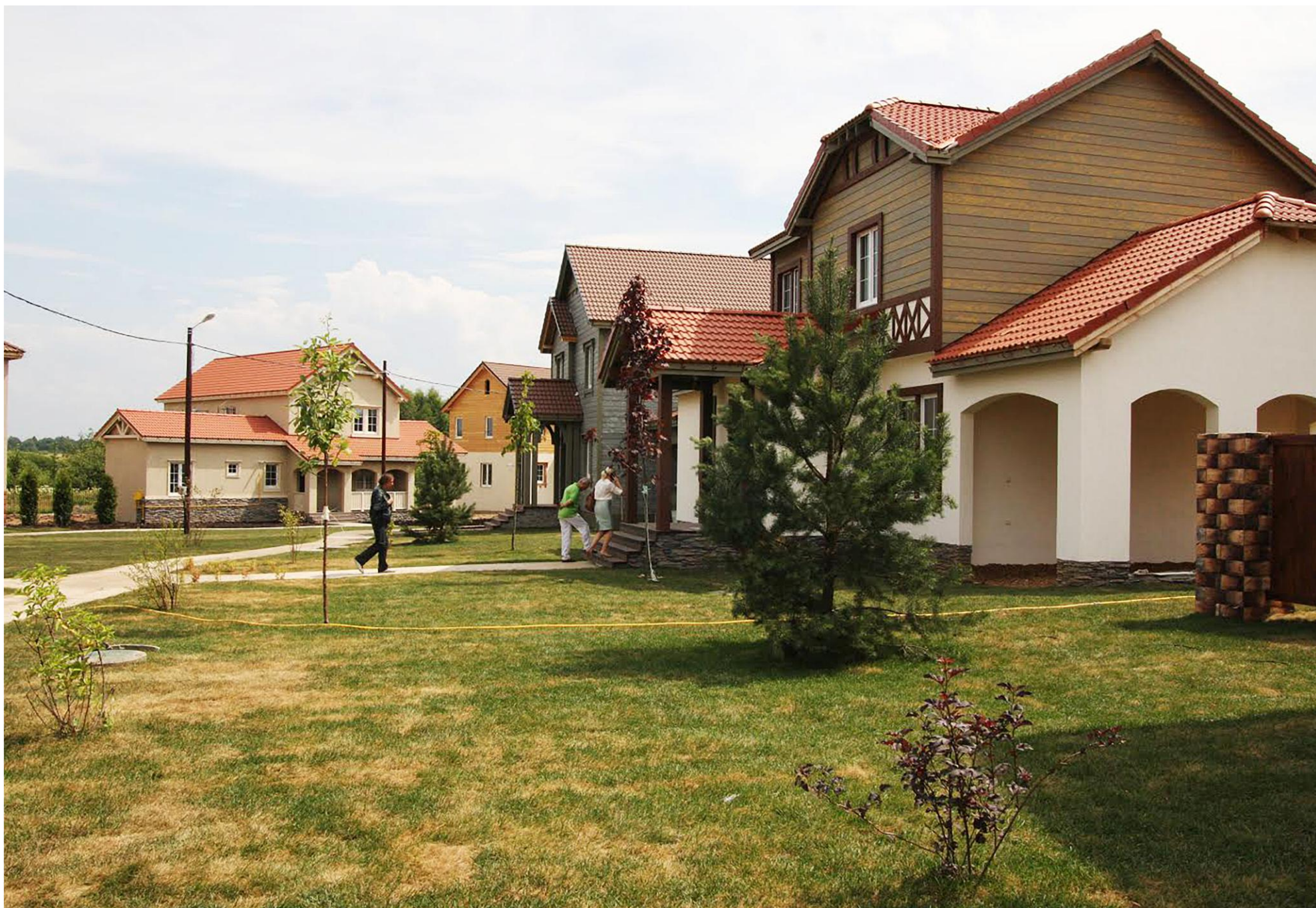
КОТТЕДЖНЫЙ ПОСЕЛОК «АМЕРИКАН ДРИМ». МОСКОВСКАЯ ОБЛАСТЬ