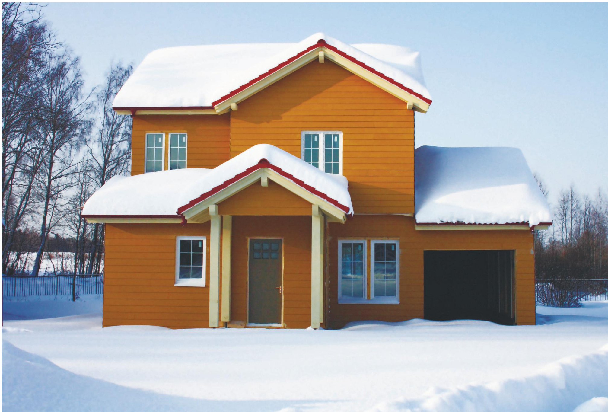
КОТТЕДЖНЫЙ ПОСЕЛОК «АМЕРИКАН ДРИМ». МОСКОВСКАЯ ОБЛАСТЬ