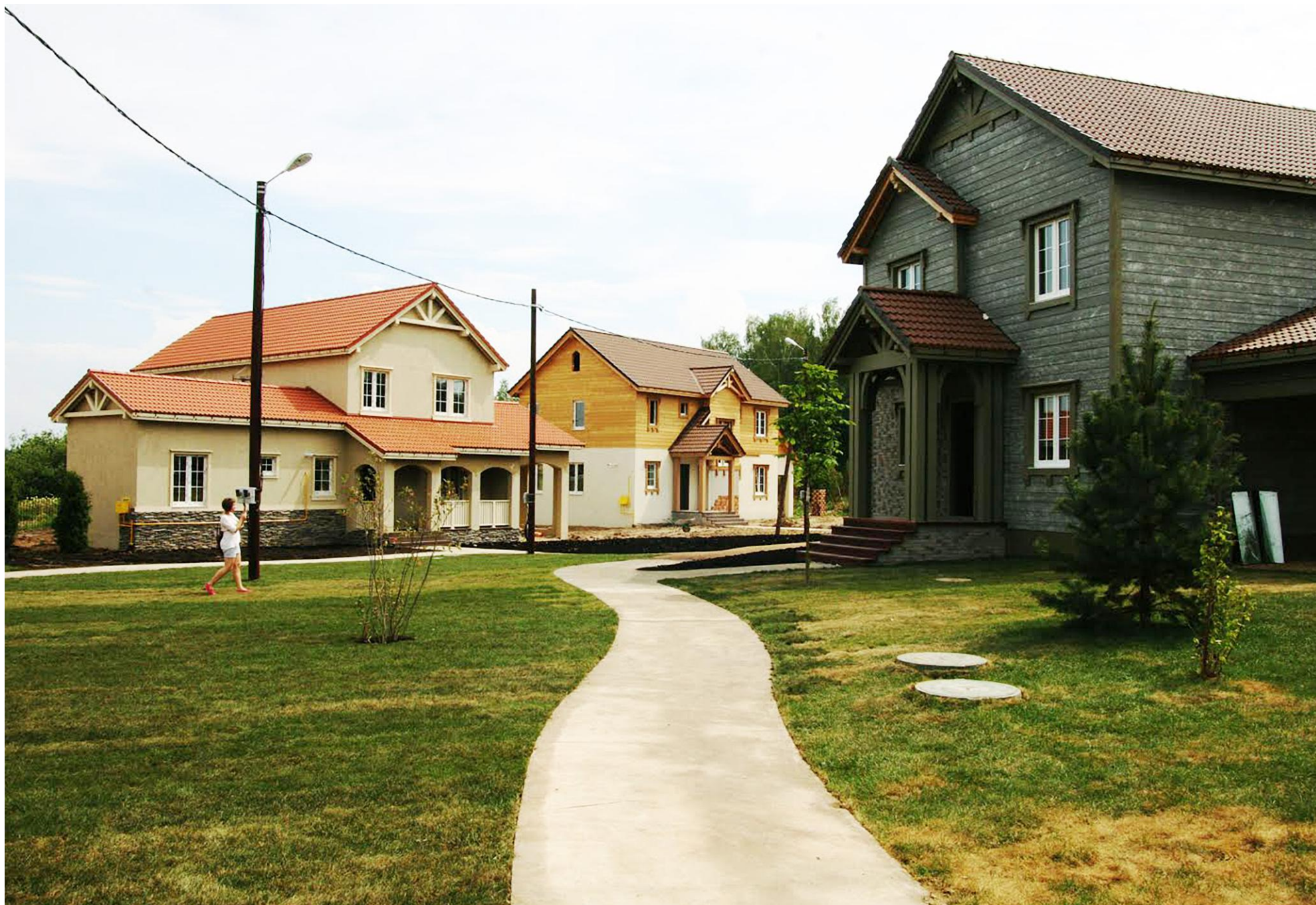
КОТТЕДЖНЫЙ ПОСЕЛОК «АМЕРИКАН ДРИМ». МОСКОВСКАЯ ОБЛАСТЬ